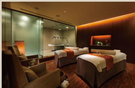
トリートメントルーム (ツイン) TREATMENT ROOM