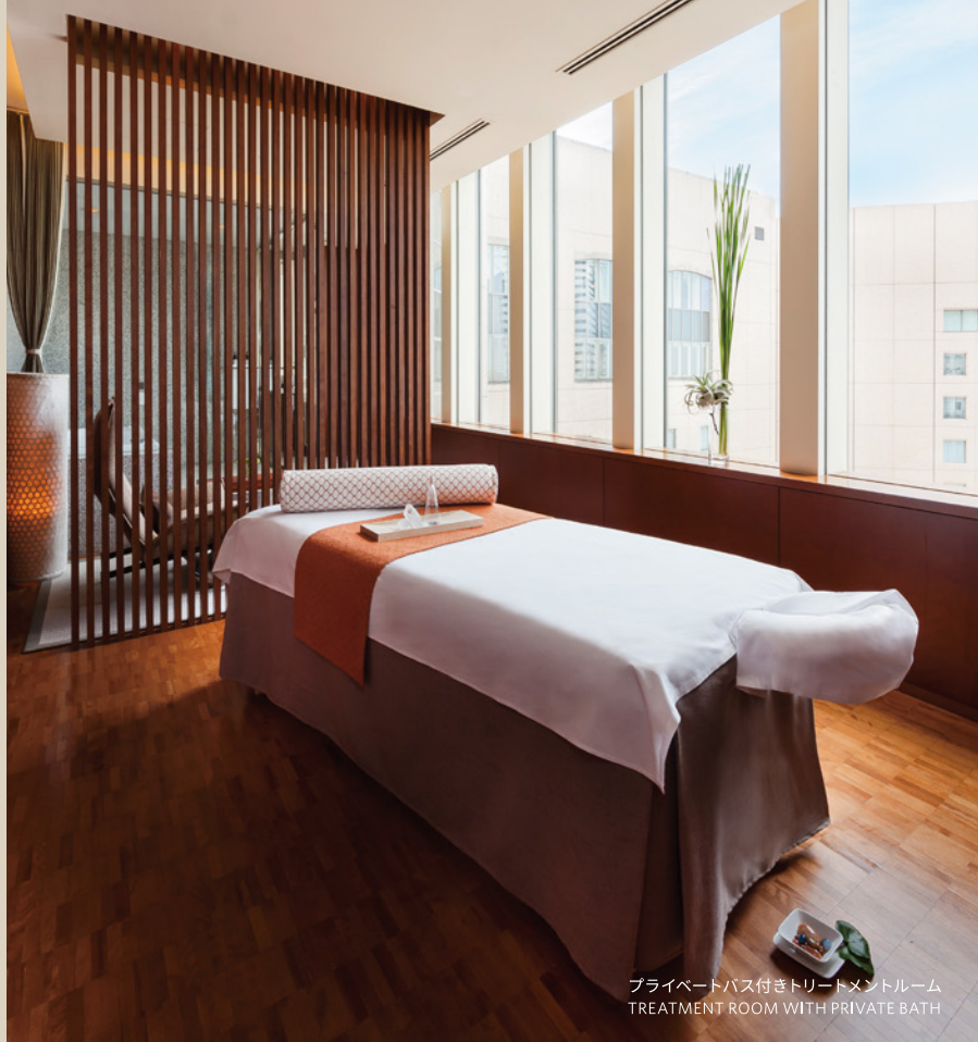
プライベートバス付きトリートメントルーム TREATMENT ROOM WITH PRIVATE BATH