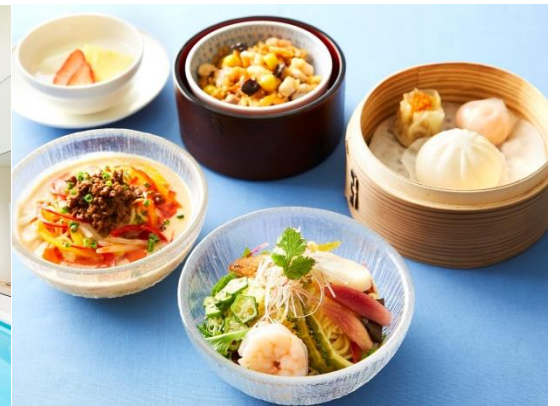
中国料理「翡翠宮(ひすいきゅう)」涼麺セット(イメージ)

ホテルスパだからこそできる贅沢なデイスパ体験を満喫いただける「サマー ビューティー スパ パッケージ」。降りそそぐ紫外線や冷房による寒暖差などで、肌も体も疲れやすいこの季節におすすめのトリートメントとランチがセットになった夏のパッケージが登場いたします。