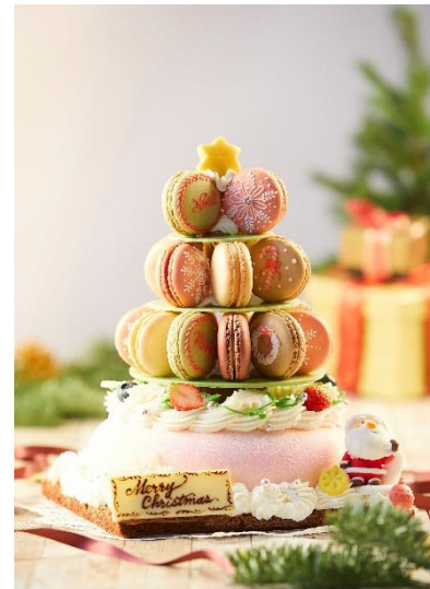
<DIYマカロンクリスマスツリー イメージ>

ホテルならではの上品な味わいと可愛らしい見た目のハイアット リージェンシー 東京のクリスマスケーキ。2020年の販売より好評いただいている「DIYクリスマスケーキ」として、今年は「DIYマカロンクリスマスツリー」が50台限定で新登場します。