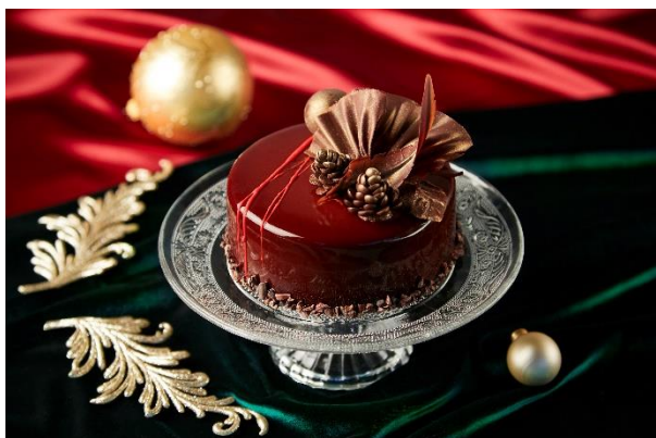
<「ショコラ プリューム」イメージ> (直径 約 12cm)