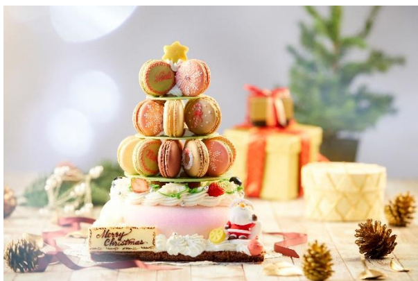
<組み立て後のイメージ> (高さ 約 30cm)