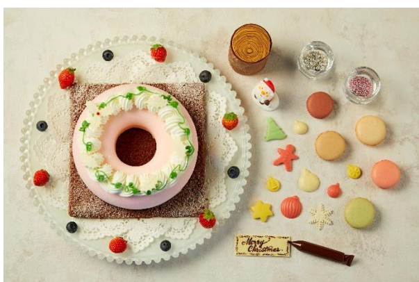
<組み立て前のイメージ> (リース直径 約 18cm)