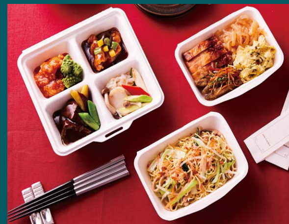
*B・Cセットイメージ

* お車でご来館いただき正面玄関でのお受け渡しも承ります。詳細はスタッフにお問い合わせください。 * 料金は消費税が含まれたお支払い金額です。*特別メニューのため他の優待との併用はご容赦ください。*画像はイメージです。 * 各ポイントプログラムのポイントでのお支払いはご容赦ください(ワールドオブハイアットのポイントは付与いたします)。